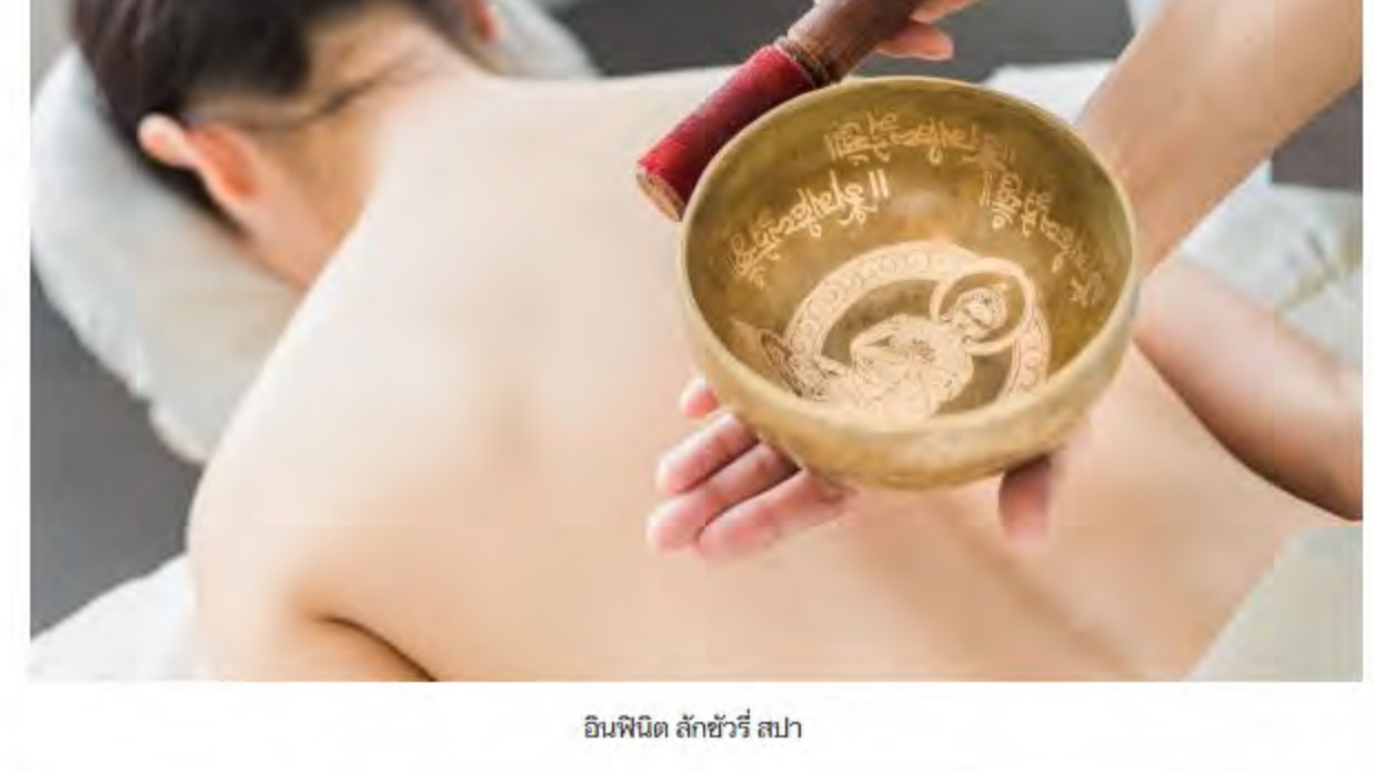
อินฟินิต ลักซ์วารี สปา

ก่อนจะไฮไลต์ที่เดอะ ซันเซต บาร์ (THE SUNSET BAR) ลิ้มรสค็อกเทลสุดหรูพิเศษที่สรรคส์สร้างโดยมิชเชิล โลจิส หรือจะเลือกจิบไวน์คุณภาพเลิศที่ผ่านการคัดสรรจากผู้เชี่ยวชาญ เพื่อดื่มด่ำช่วงเวลาของพระอาทิตย์ตกดินที่สวยที่สุดในภูเก็ต แต่หากคุณต้องการประสบการณ์อันแปลกใหม่ขอแนะนำต้องมาที่ ไดนิ่ง ออน เดอะ รีออล์ (DINING ON THE ROCKS) การรับประทานอาหารที่ลานหิน พร้อมทั้งยังมีห้องทะเลเล่นน้ำแบบเป็นฉากหลังในบรรยากาศสุดแสนโรแมนติคที่จะทำให้คืนเนอร์รี่ของคุณและคนรักพิเศษกว่าที่เคย