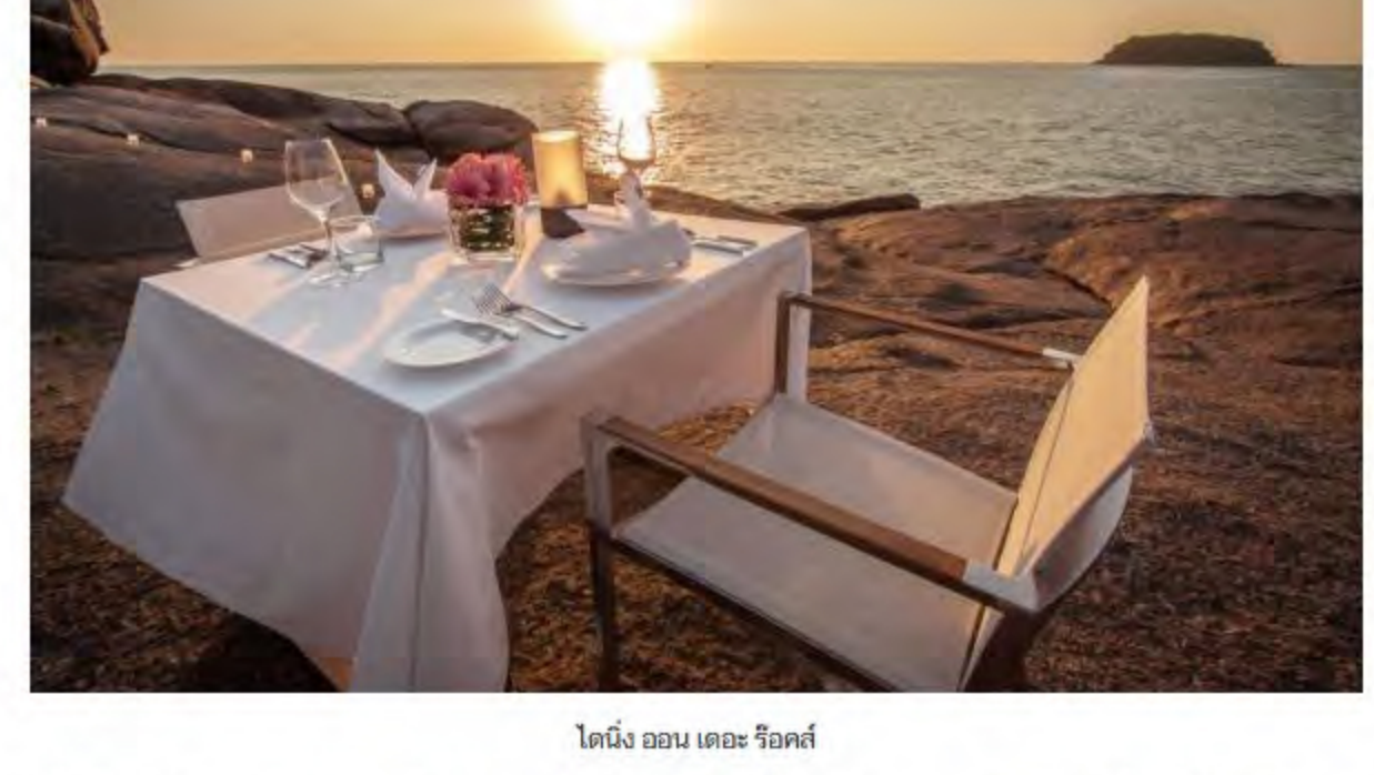
ไดนิ่ง ออน เดอะ รีออล์

อีกหนึ่งความประทับใจที่ HELLO! บอกเลยว่าไม่มีไฮไลต์ที่ต้องเช็กอินกับสระว่ายน้ำแบบไร้ขอบที่ยาวกว่า 35 เมตร ที่ทำให้เราเพลิดเพลินไปกับการว่ายน้ำพร้อมวิวทะเลภูเก็ตแบบพาอรามา