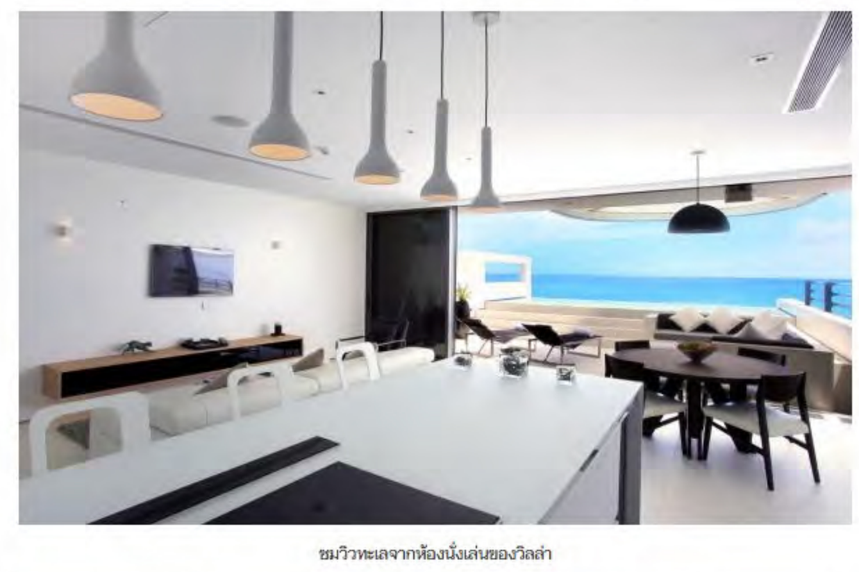
ชมวิวดูทะเลจากห้องนั่งเล่นของวิลล่า