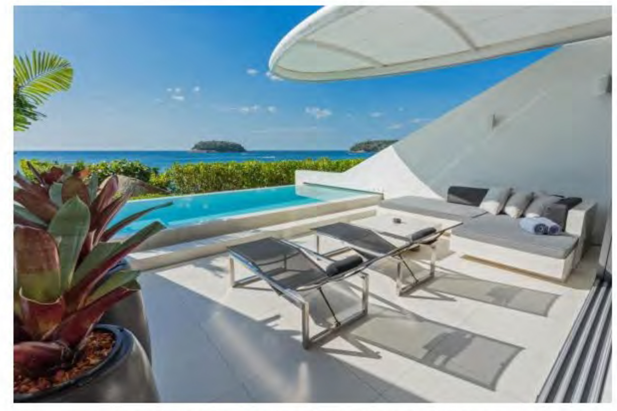
ระเบียงด้านนอกจัดวางด้วยเบาะและเก้าอี้อามแดดเพื่อการพักผ่อนที่สมบูรณ์แบบ