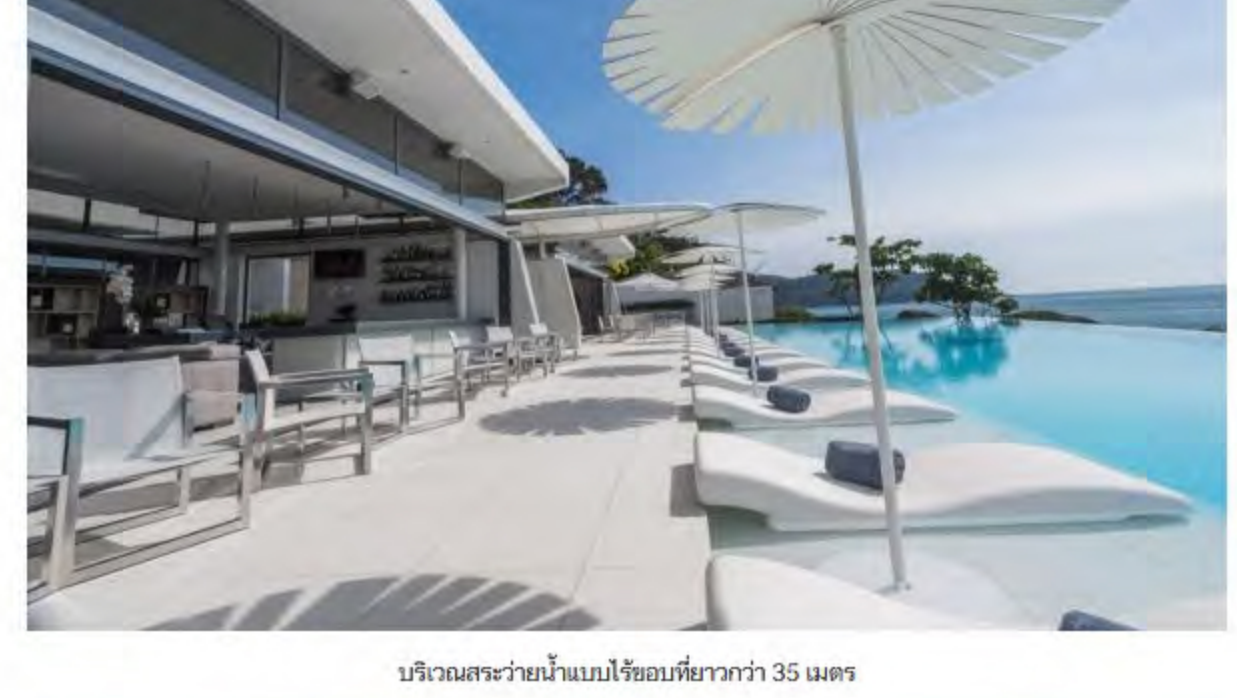
บริเวณสระว่ายน้ำแบบไร้ขอบที่ยาวกว่า 35 เมตร

เมื่อคุณเลือกพักผ่อนที่เกาะรีออล์ นอกจากจะได้สัมผัสความสงบและเป็นส่วนตัวท่ามกลางธรรมชาติแล้ว ที่นี่ยังพร้อมไปด้วยความสะดวกสบายระดับไฮเอนด์ที่รับรองว่าต้องประทับใจ โดยสกายวิลล่าทุกหลัง จะมีสระว่ายน้ำส่วนตัว ระเบียงด้านนอกจัดวางด้วยเบาะและเก้าอี้อามแดดเพื่อการพักผ่อนที่สมบูรณ์แบบ มีห้องนั่งเล่น และส่วนของพื้นที่รับประทานอาหารที่กว้างขวาง พร้อมทั้งห้องนอนและห้องอาบน้ำที่ได้รับการตกแต่งอย่างหรูหรา อีกทั้งยังตอบโจทย์ไลฟ์สไตล์อันทันสมัยกับนวัตกรรมการควบคุมระบบอัตโนมัติ ภายในวิลล่าด้วยไอแพด ซึ่งยังไม่เคยมีที่ใดให้บริการในภูเก็ต ไม่ว่าจะเป็นการควบคุมระบบแสงสว่าง อุณหภูมิเครื่องปรับอากาศภายใน เพลง โทรทัศน์ ม่านบังแสง แม้แต่การขอรับบริการต่างๆ ในวิลล่าแต่ละหลัง ก็สามารถทำได้เพียงปลายนิ้วสัมผัส