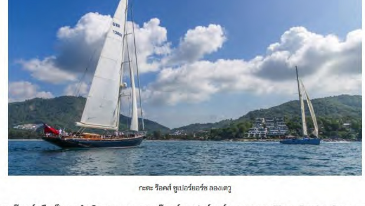
เกาะรีออล์ ซูเปอร์ยอร์ช ลองเดวู

หากมาเป็นครอบครัวที่เกาะรีออล์ ก็ยังมีกิจกรรมอีกมากมายให้ได้เอ็นจอยกันทั้งวัน ทั้งการเรียนทำอาหารไทยในวิลล่าส่วนตัว หรือจะผ่อนคลายไปกับ อินฟินิต ลักซ์วารี สปา ที่ได้ระดับรางวัลชนะเลิศ ด้วยรูปแบบที่ทันสมัยและการบำบัดเฉพาะบุคคล เช่นเครื่องช่วยการพักผ่อน (Energy Pod) และการนวดบำบัดด้วยแสง 7 ตรรกะ(Chromo-therapy Treatments) ผสมผสานระหว่างศาสตร์การนวดแผนไทยโบราณ กับผลิตภัณฑ์สปาออร์แกนิก ILA จากประเทศอังกฤษ พร้อมทั้งยังมีห้องออกกำลังกายที่ทันสมัย ในขณะที่เด็กๆนั้นก็สามารถสนุกสนานอยู่กับคิสส์เดย์ ซึ่งนี่เตรียมไว้สำหรับบริการน้องๆทุกคน