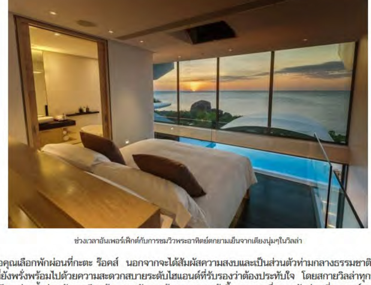
ช่วงเวลาอันเพอร์เฟ็คกับการชมวิวดูพระอาทิตย์ตกยามเย็นจากเตียงนุ่มๆในวิลล่า

เมื่อคุณเลือกพักผ่อนที่เกาะรีออล์ นอกจากจะได้สัมผัสความสงบและเป็นส่วนตัวท่ามกลางธรรมชาติแล้ว ที่นี่ยังพร้อมไปด้วยความสะดวกสบายระดับไฮเอนด์ที่รับรองว่าต้องประทับใจ โดยสกายวิลล่าทุกหลัง จะมีสระว่ายน้ำส่วนตัว ระเบียงด้านนอกจัดวางด้วยเบาะและเก้าอี้อามแดดเพื่อการพักผ่อนที่สมบูรณ์แบบ มีห้องนั่งเล่น และส่วนของพื้นที่รับประทานอาหารที่กว้างขวาง พร้อมทั้งห้องนอนและห้องอาบน้ำที่ได้รับการตกแต่งอย่างหรูหรา อีกทั้งยังตอบโจทย์ไลฟ์สไตล์อันทันสมัยกับนวัตกรรมการควบคุมระบบอัตโนมัติ ภายในวิลล่าด้วยไอแพด ซึ่งยังไม่เคยมีที่ใดให้บริการในภูเก็ต ไม่ว่าจะเป็นการควบคุมระบบแสงสว่าง อุณหภูมิเครื่องปรับอากาศภายใน เพลง โทรทัศน์ ม่านบังแสง แม้แต่การขอรับบริการต่างๆ ในวิลล่าแต่ละหลัง ก็สามารถทำได้เพียงปลายนิ้วสัมผัส