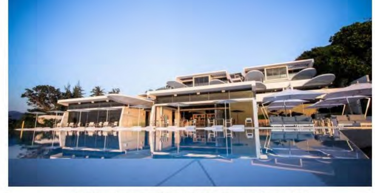
ดีไซน์อันโดดเด่นและการเลือกใช้สีขาวตัดกับสีฟ้าอันเป็นเอกลักษณ์ของเกาะรีออล์

เชื่อว่าดีไซน์อันโดดเด่นของ เกาะรีออล์ ที่ออกแบบโดยได้รับแรงบันดาลใจมาจากเรือซูเปอร์ยอร์ชที่ค้อมนต์ สะกดแรกที่ทำให้ใครๆต่างตกหลุมรักริสอร์ทสุดหรูแห่งนี้ตั้งแต่แรกเห็น ด้วยความทันสมัยที่รายล้อมทั้ง ความงามของธรรมชาติจากชายหาดระดับอันโด่งดังทำให้สกายวิลล่ากว่า 34 หลัง ที่มีตั้งแต่หนึ่งห้องนอน จนถึงสี่ห้องนอนของที่นี่มีวิวโดยรอบที่โรแมนติคติดระดับโลกเลยทีเดียว