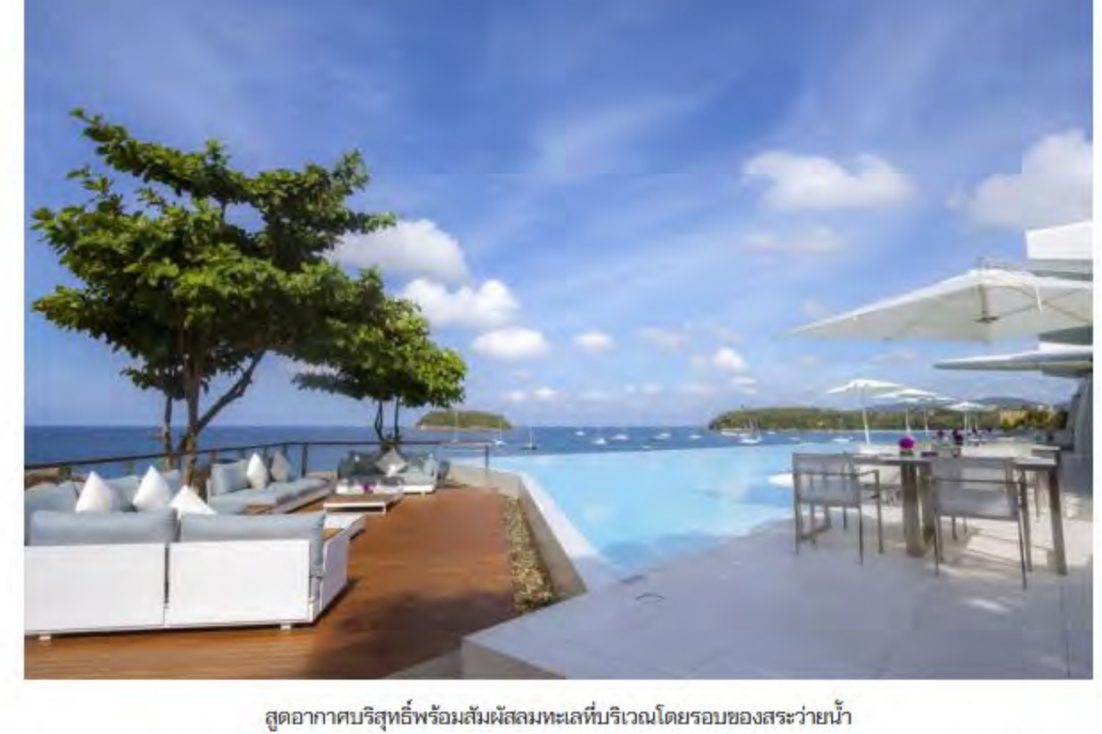
จุดอากาศบริสุทธิ์พร้อมลิ้นจี่ขณะนั่งที่บริเวณโดยรอบของสระว่ายน้ำ

อีกหนึ่งความประทับใจที่ HELLO! บอกเลยว่าไม่มีไฮไลต์ที่ต้องเช็กอินกับสระว่ายน้ำแบบไร้ขอบที่ยาวกว่า 35 เมตร ที่ทำให้เราเพลิดเพลินไปกับการว่ายน้ำพร้อมวิวทะเลภูเก็ตแบบพาอรามา