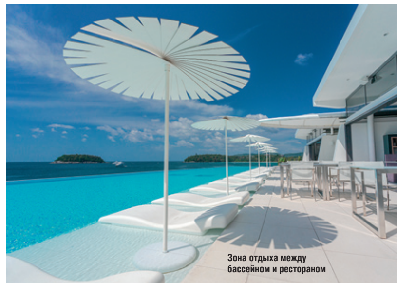
Зона отдыха между бассейном и рестораном