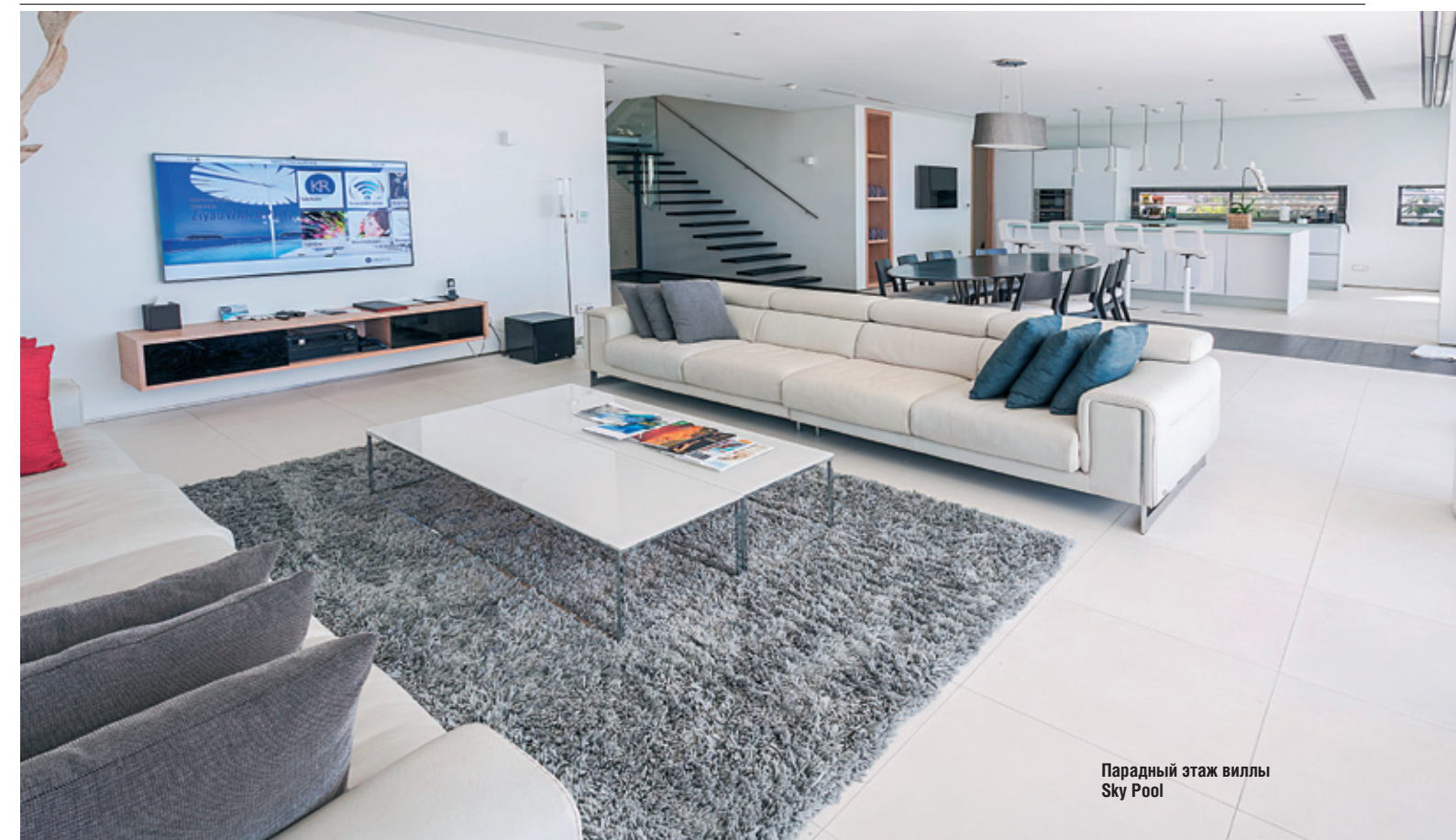
Парадный этаж виллы Sky Pool