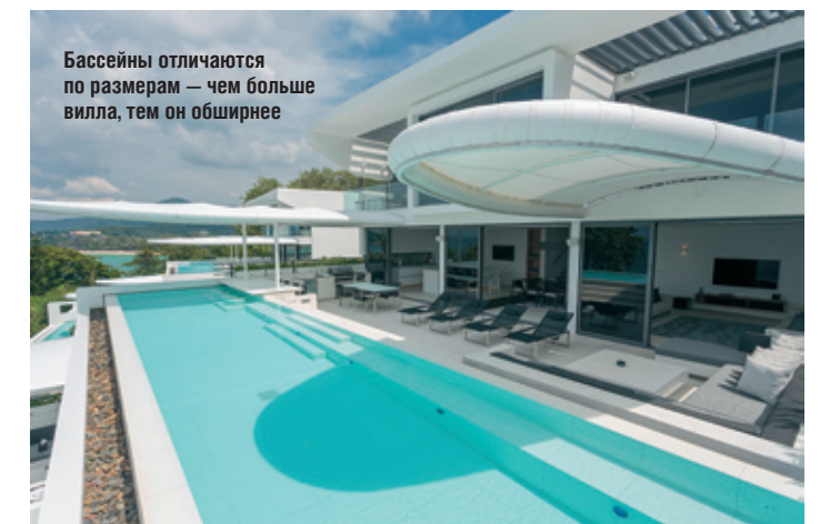
Бассейны отличаются по размерам — чем больше вилла, тем он обширнее