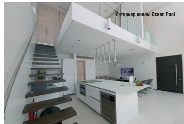
Интерьер виллы Ocean Pool