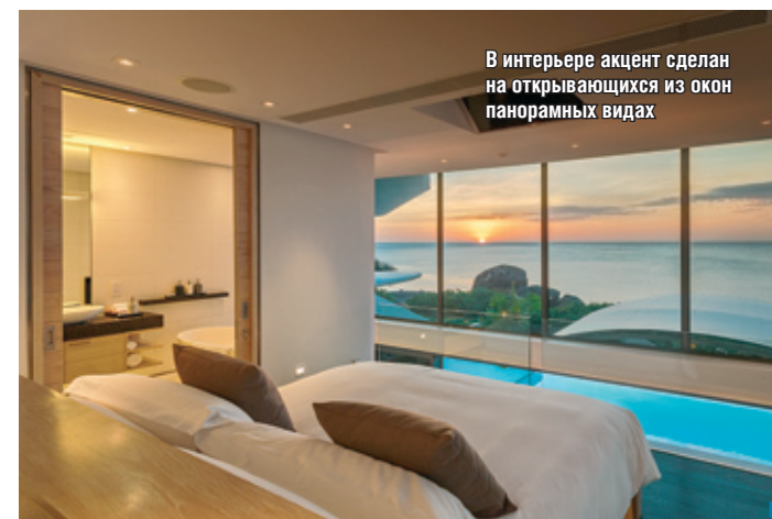
В интерьере акцент сделан на открывающихся из окон панорамных видах

зона, на втором — частные помещения. Каждая из вилл имеет свой собственный открытый бассейн с зоной отдыха и площадкой барбекю, просторную гостиную и столовую, отлично оборудованную кухню, со вкусом оформленные спальни и ванные комнаты.