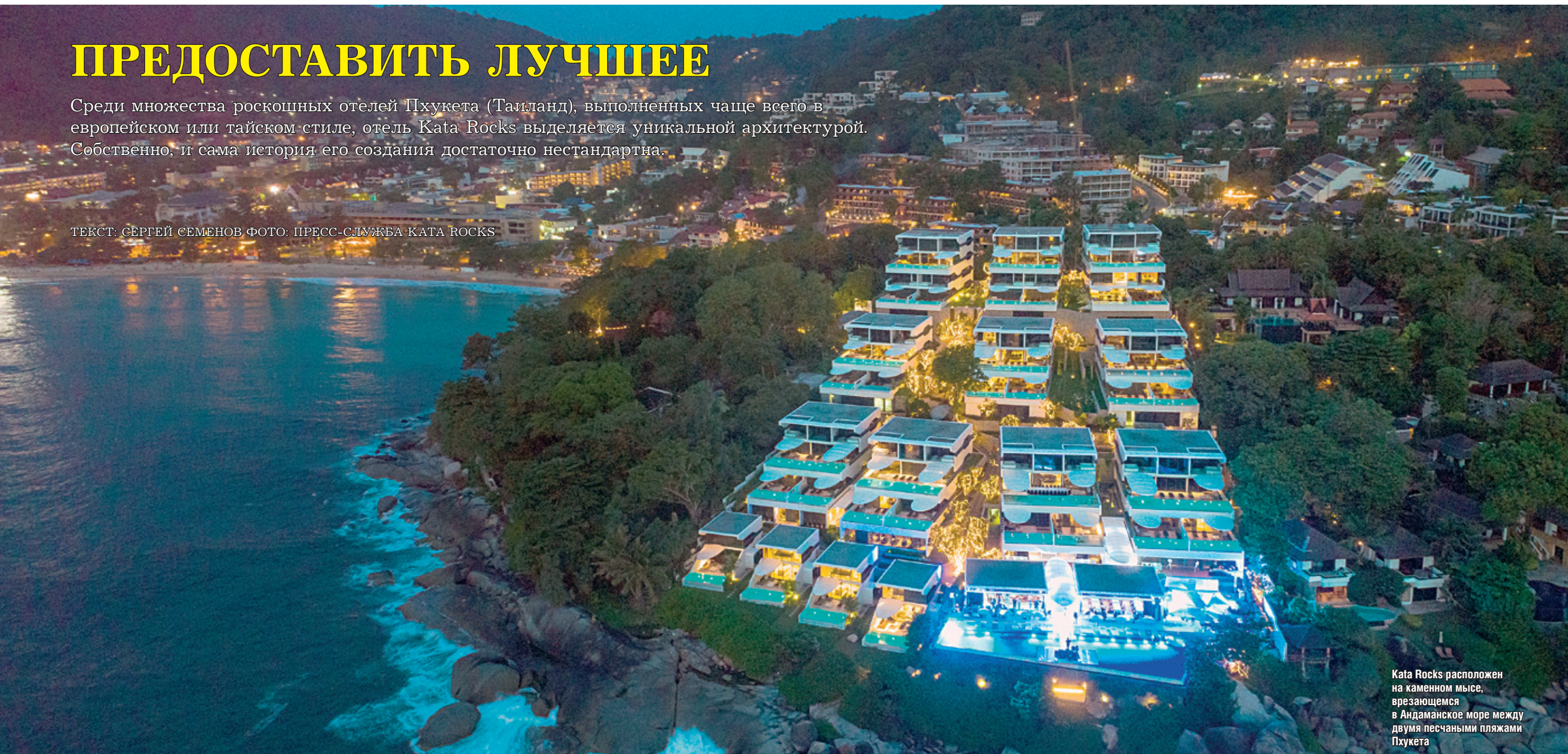
Kata Rocks расположен на каменном мысе, врезающемся в Андаманское море между двумя песчаными пляжами Пхукета

ТЕКСТ: СЕРГЕЙ СЕМЕНОВ