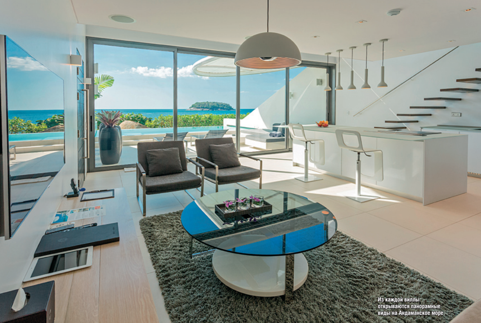
Из каждой виллы открываются панорамные виды на Андаманское море