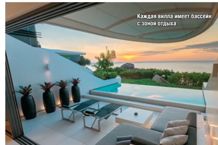
Каждая вилла имеет бассейн с зоной отдыха