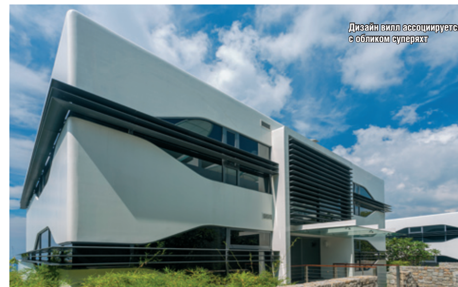
Дизайн вилл ассоциируется с обликом суперяхт