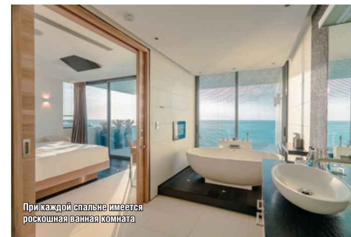
При каждой спальне имеется роскошная ванная комната