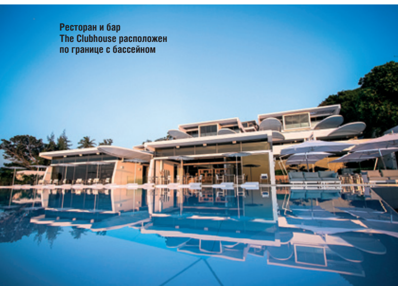
Ресторан и бар The Clubhouse расположен по границе с бассейном

Курорт, управляемый компанией Infinite Luxury, располагает прекрасной, ухоженной территорией и 34 роскошными, отдельно стоящими виллами: лофты Ocean Pool с одной спальней, виллы Sky Pool с двумя, тремя и четырьмя спальнями, площадью от 134 до 460 кв. м. Все здания двухэтажные: на первом уровне находятся парадная »